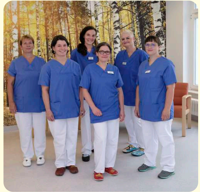
Unserer Hebammenteam in Zittau

Wir freuen uns auf Sie und sind gern für Sie da! Bis bald bei uns!