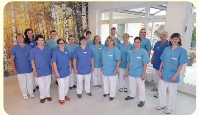
Unsere Hebammen und Krankenschwestern auf Station 3 in Zittau